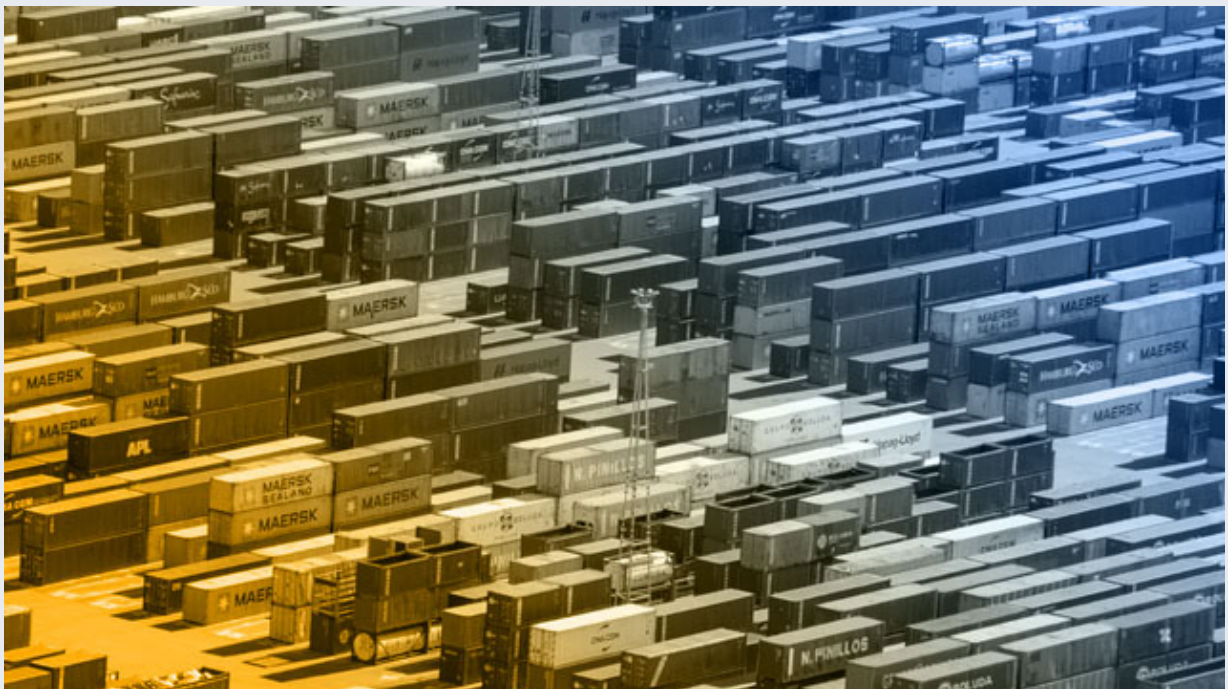
Bergfest für Buss Container 79